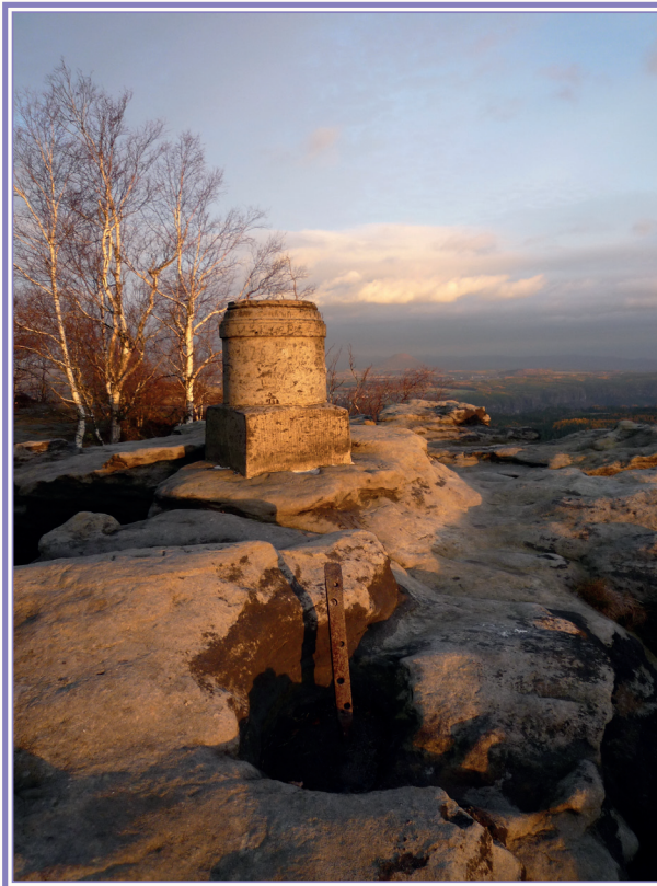
Großer Schirnstein (Südaussicht)