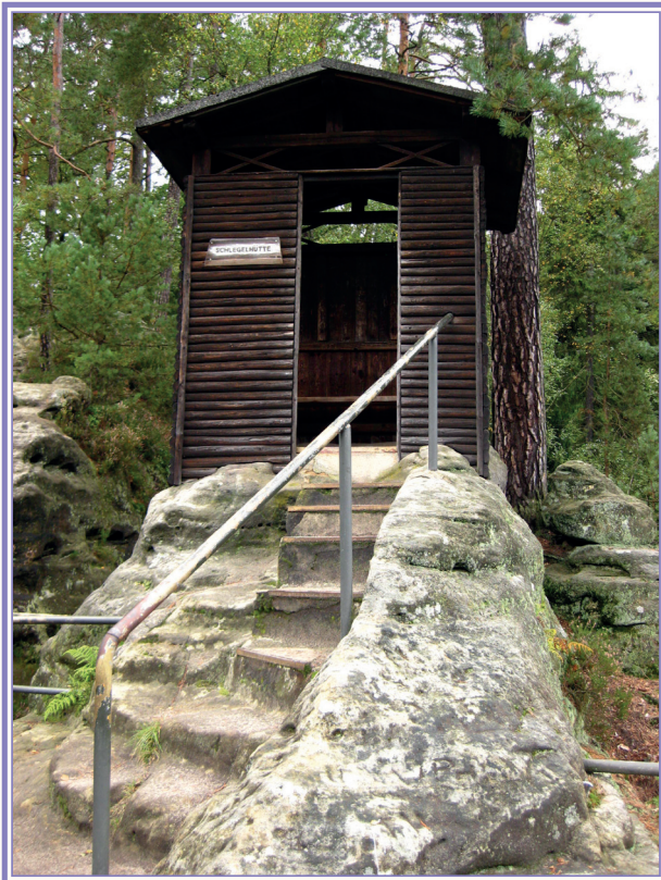
Schlegelhütte am Hermannseck

Ich hab` dich lieb. Das klingt so süß. Und klingt so reif. Ein Sommerlaut, wenn rings der Blick im Vollbesitz auf segenschöne Felder schaut. Gustav Falke