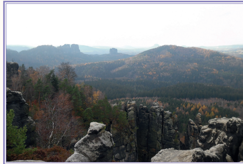
Langes Horn (Ausstieg Häntzschelstiege)